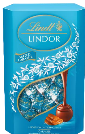
LINDOR Kugeln Salted Caramel

Ob als liebevolles Geschenk, als Mitbringsel oder zum selbst Genießen als kleine Auszeit vom Alltag: Mit LINDOR Salted Caramel im beliebten 500g Cornet oder der praktischen 100g Tafel sind viele, kleine Glücksmomente garantiert.